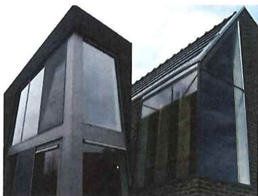
voorbeelden van afwijkende materialen binnen kader: cortenstaal, keimwerk en hout