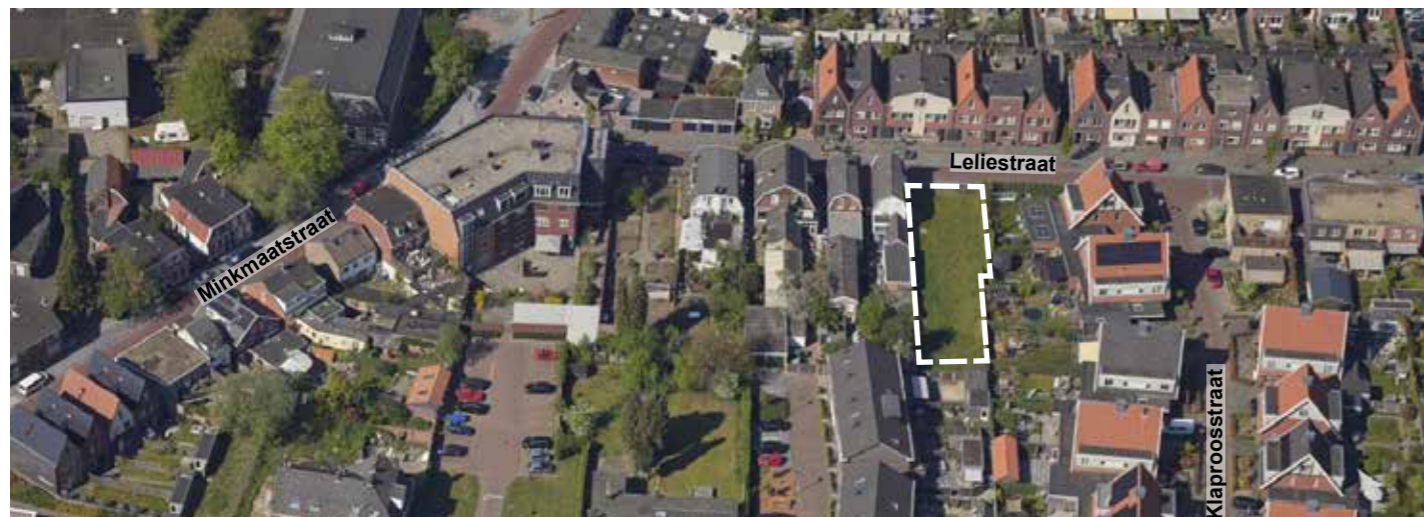
Ondanks dat grote zorgvuldigheid aan het opstellen van dit kavelpaspoort is besteed kunnen aan deze tekst geen rechten worden ontleend.