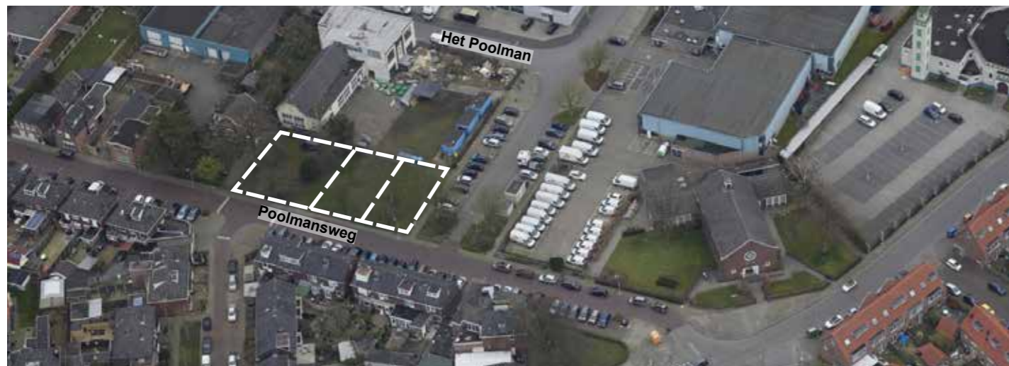
Ondanks dat grote zorgvuldigheid aan het opstellen van dit kavelpaspoort is besteed kunnen aan deze tekst geen rechten worden ontleend.